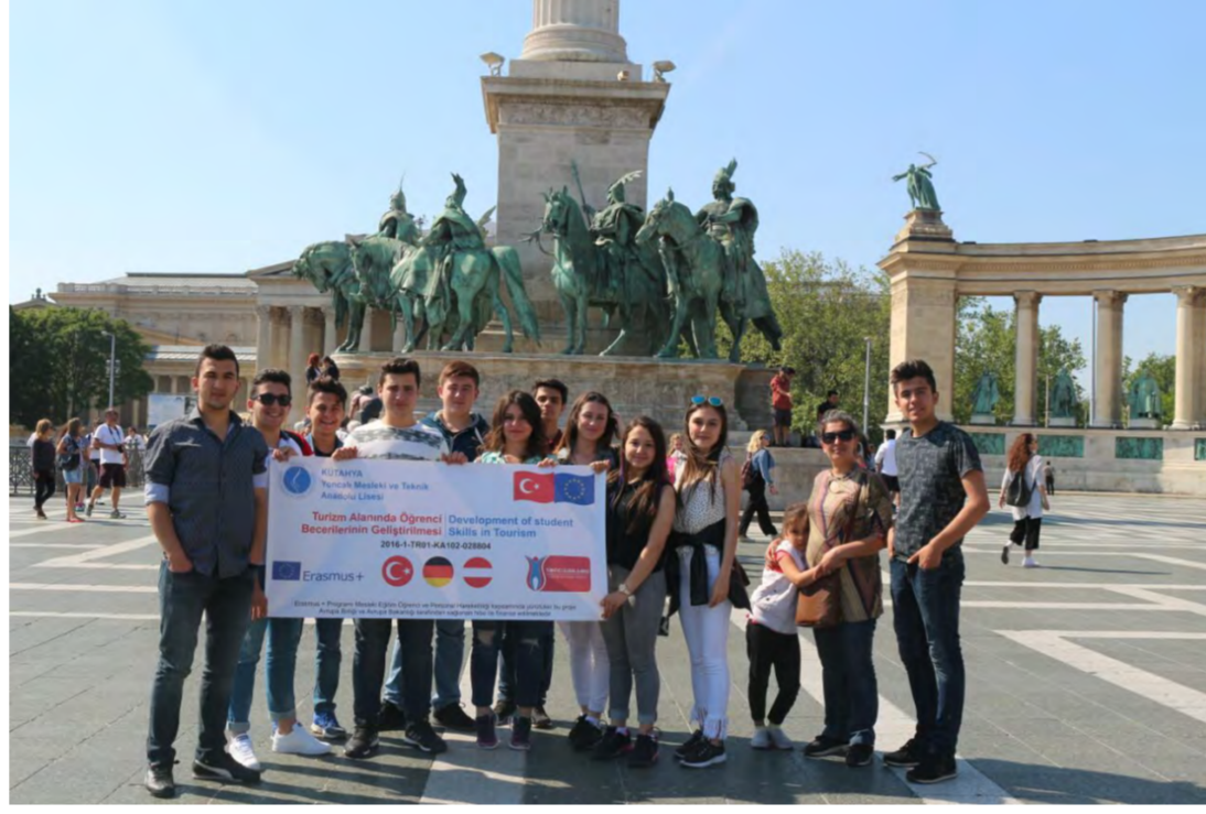
Haftasonu Budapeşte Gezisi