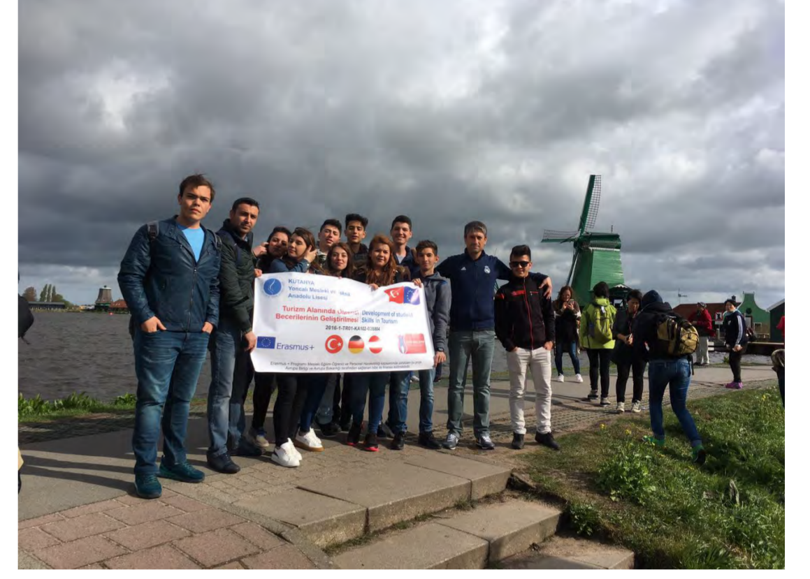
Haftasonu Hollanda Gezisi