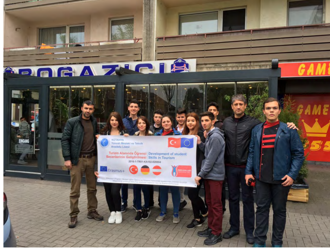
Almanya'da Staj Yapılan Restoran