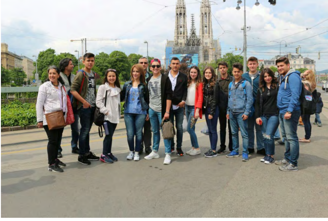
Viyana Tanıtım Turu