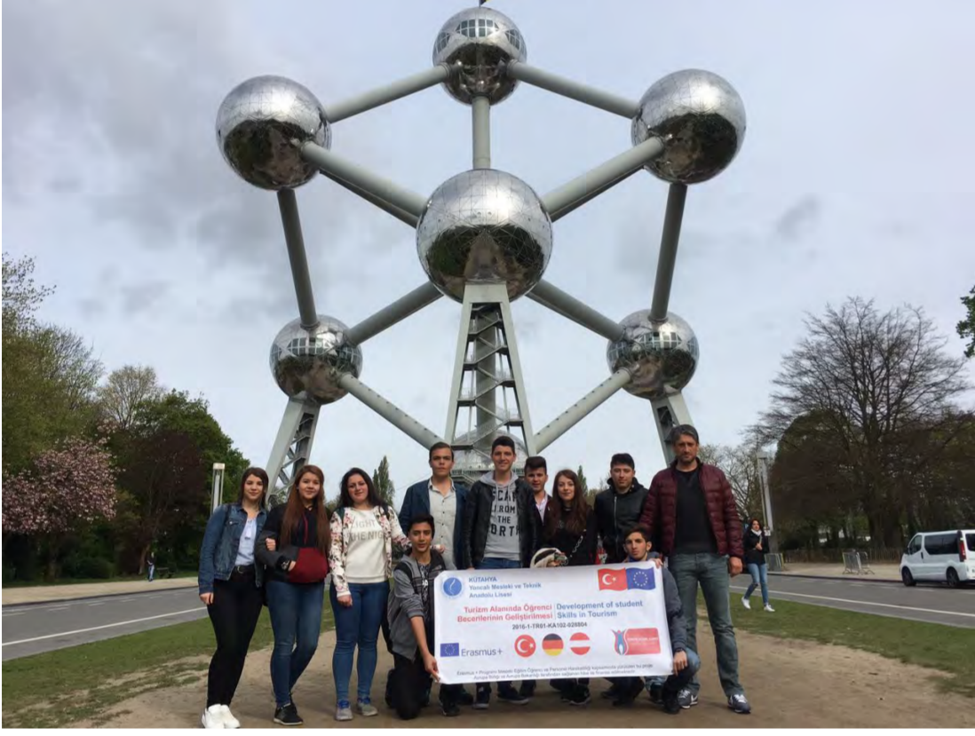
Haftasonu Belçika Gezisi