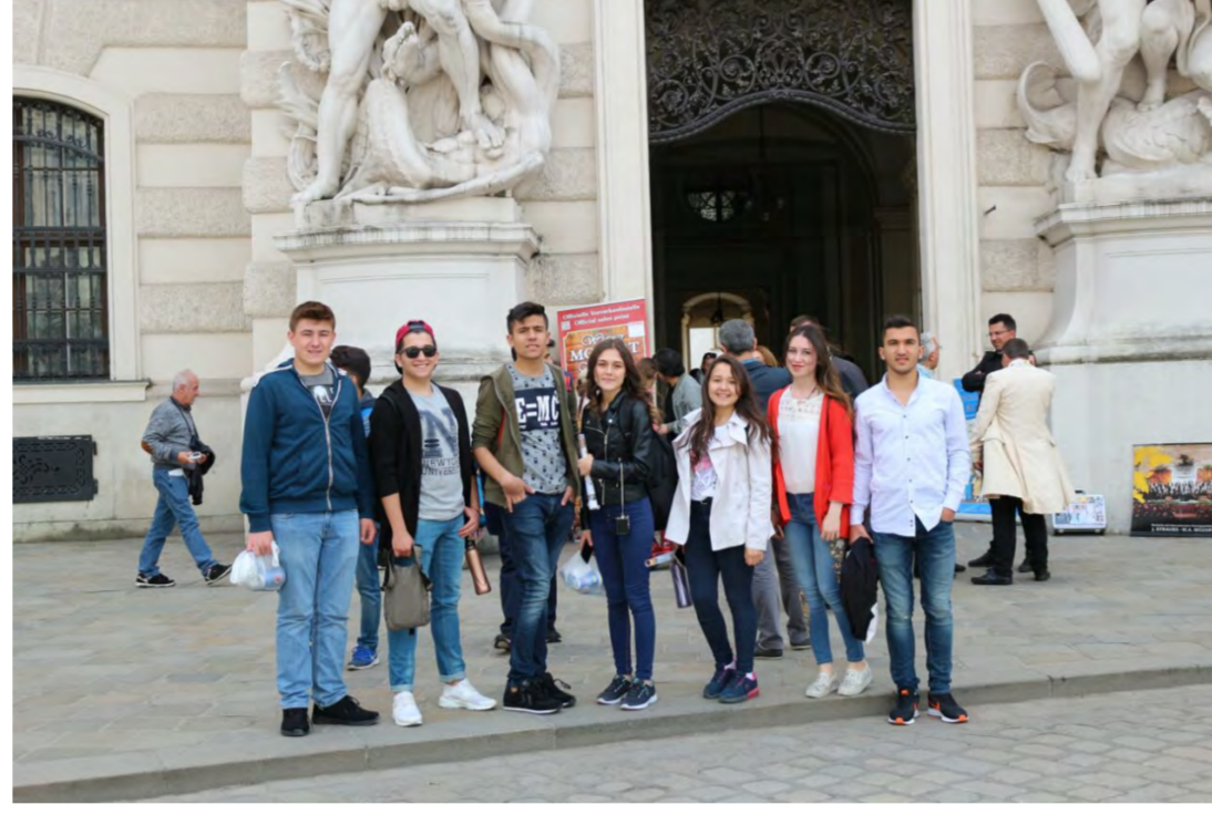
Viyana Kültürel Etkinlik