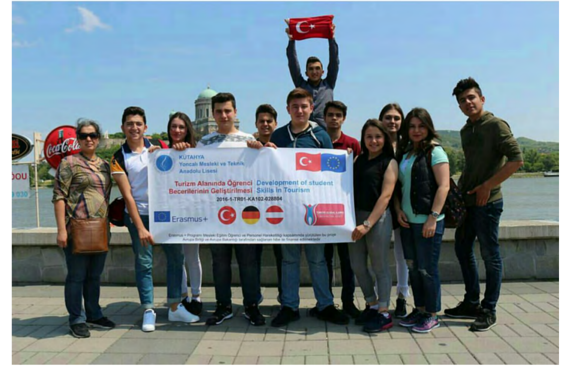
Budapeşte Estergon Kalesi