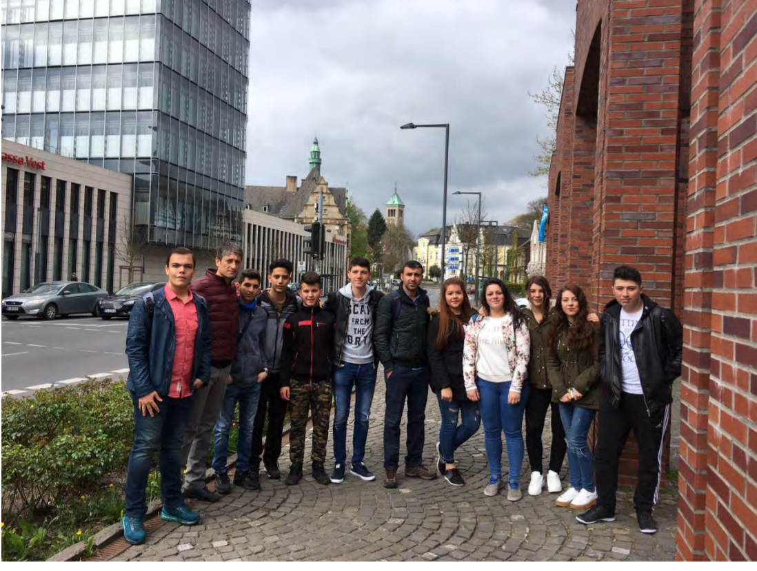
Almanya Genel Tanıtım ve Kültürel Etkinlikler