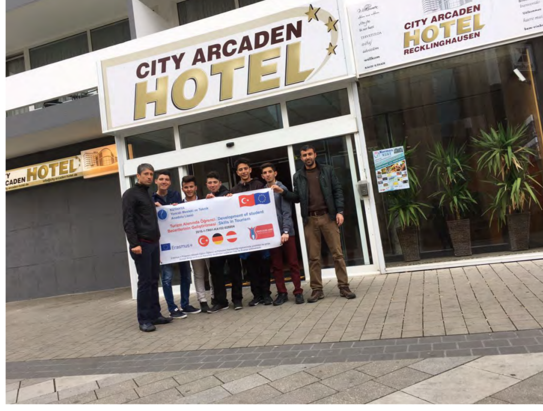
Almanya'da Staj Yapılan Hotel