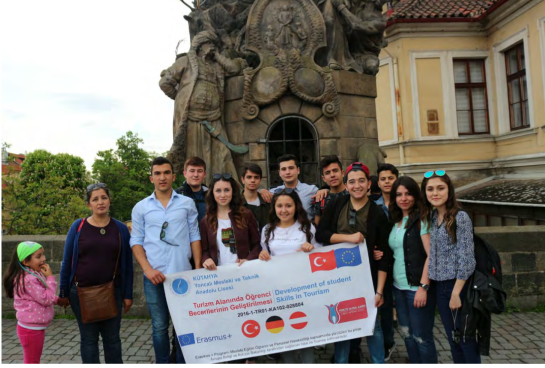
Haftasonu Prag Gezisi